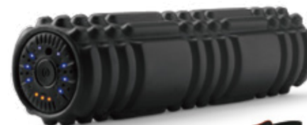
黑色 / MR-001BK JAN : 4580235554883